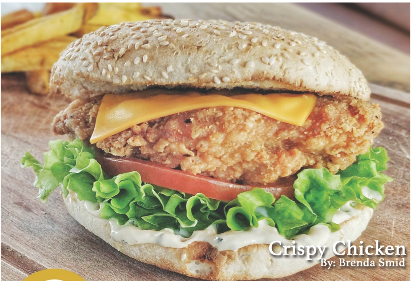
Crispy Chicken By: Brenda Smid