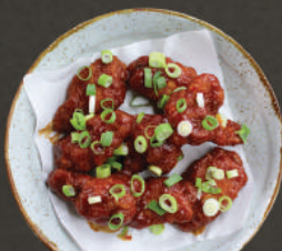
SMOKEY BBQ WINGS met bosuitjes Nu nog lekkerder!