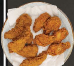
CHICKEN SNACKBOX met BBQ & chili saus Vernieuwd!